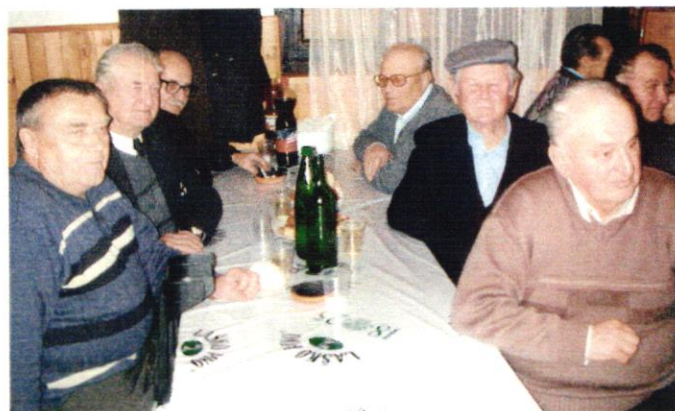
TRADICIONALNO SREČANJE GASILSKIH VETERANOV – Četrto srečanje je Občinska gasilska zveza pripravila zadnjo soboto v Fokovcih. Tudi tokrat se je zbralo veliko število veteranov, srečanje pa je minilo v prijetnem razloženju.