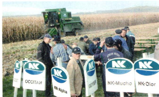
POSKUSNA PRIDELAVA KORUZE – Vitezovi iz Tešanovec so dolgoletni poskusniki semenske hiše Syngenta. Strokovnjaki so ugotavljali najboljše rezultate pri sorti NK Kanada: izjemno visok hektarski pridelek in nizko vlažnost v letošnjih neugodnih vremenskih razmerah.