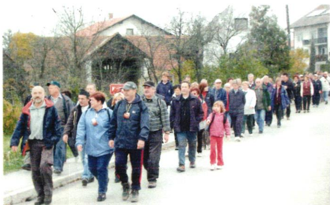
SEZONA POHODOV – Pohodi so pritegnili stotine ljubiteljev narave in postali imenitne rekreacijske in družabne prireditve. Posnetek je z letošnjega Martinovega pohoda na Jelovškov breg.