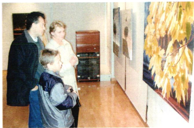
SLIKARSKA KOLONIJA PRIMOŽ TRUBAR 2004 – Bero jubilejne slikarske kolonije, ki že deset let domuje v Moravskih Toplicah, so v novembru postavili na ogled v galeriji Kluba Pac v Murski Soboti.