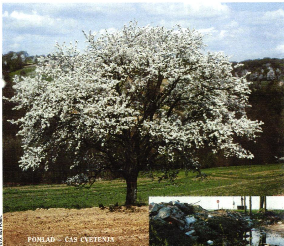
POMLAD – ČAS CVETENJA