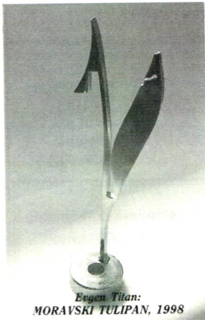
Evgen Titan: MORAVSKI TULIPAN, 1998