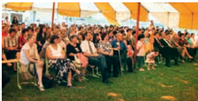
OŠ FOKOVCI OB JUBILEJU – Pred koncem šolskega leta so v Fokovcih proslavili 140-letnico tamkajšnje šole. Slovesno, vzneseno, kot se za visoki jubilej spodobi.