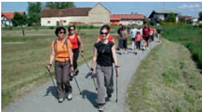
DNEVI NORDIJSKE HOJE V MARTJANCIH – Kar tri dni so trajali: začeli so se s predavanjem, nadaljevali in končali pa s pohodom.