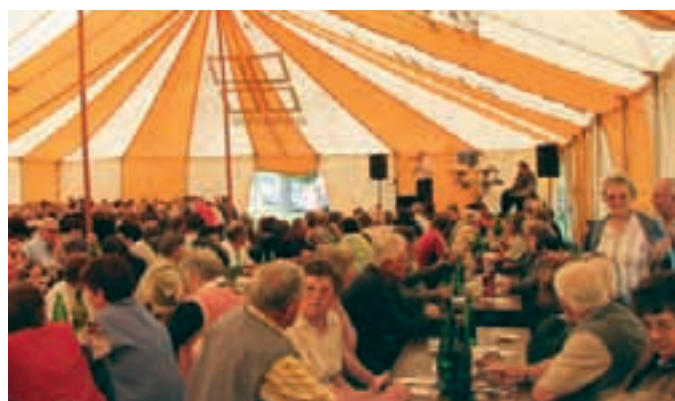
UPOKOJENSKI PIKNIK V IVANCIH – Blizu 300 upokojencev, članov Društva upokojencev občine Moravske Toplice, se je v začetku junija zbralo na tradicionalnem spomladanskem pikniku – tokrat ob nekdanji šoli v Ivancih.

besedilo: Ludvik Sočič