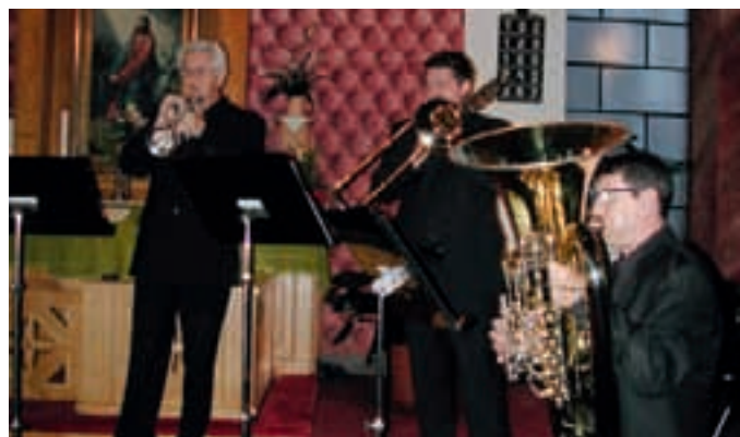
NASTOP SLOVENSKEGA KVINTETA TROBIL – V okviru Glasbenega maja je v evangeličanski cerkvi v Moravskih Toplicah nastopil Slovenski kvintet trobil. Koncertno turnejo vrhunskih glasbenikov v pokrajini organizira soboški klub PAC.