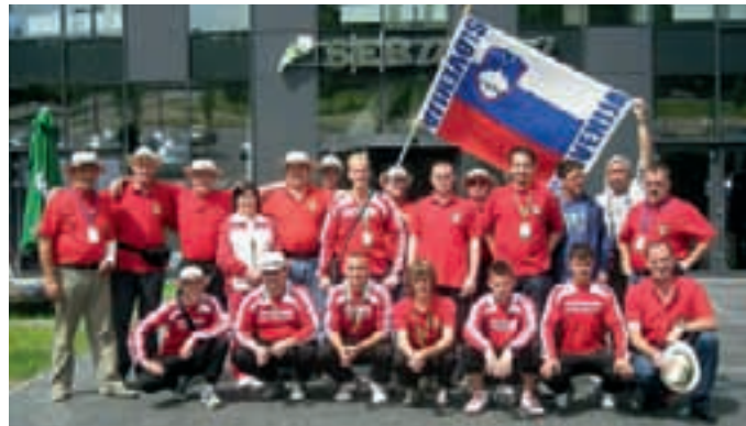
ZMAGOVITI HOKEJISTI – Iz Litve so se prepolni evforičnega navdušenja vrnili igralci in navijači HK Moravske Toplice: na turnirju Challenge IV so prepričljivo osvojili prvo mesto.