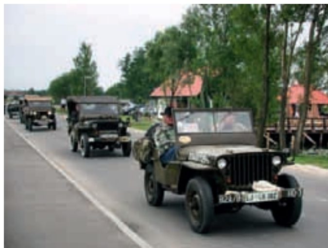
MEDNARODNO SREČANJE VOJAŠKIH VOZIL – Lani ustanovljeni Jeep klub Veterani Murska Sobota je pripravil 1. mednarodno srečanje vojaških vozil. Večina izmed 40 zbranih vozil izvira iz časa pred ali med drugo svetovno vojno. Po Prekmurju in Prlekiji so prevozili več kot sto kilometrov, ustavili so se tudi pri gostišču Oaza in v Moravskih Toplicah.