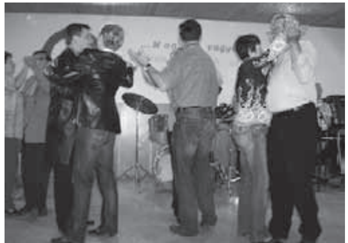
A helybeliek és az elszármazottak még táncra is perdültek.

A jelenlévők hangoztatták, hogy jövőre újra szeretnének eljönni.