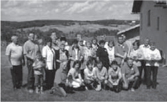
A pártosfalvi elvándoroltak.