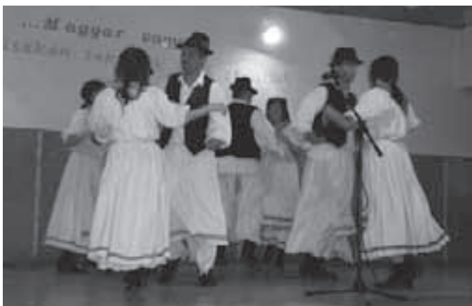
A táncegyüttes határmenti táncokkal színesítette a programot.