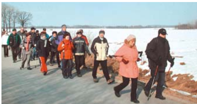
ČAS POHODOV – Samo v tej številki Lipnice poročamo treh različnih pohodih v naši občini. Ta oblika rekreacije, sprostitve in razvedrila dobiva razveseljive razsežnosti, saj smo prešteli že sedem različnih pohodov: Martinov (Martjanci-Jelovškov breg), Prešernov pohod v organizaciji KTD Tešanovci, Pohod po Sladki poti, Pohod po čebeljih poteh, Trikralski pohod v Filovcih; na novo so začeli v Vučji Gomili (Štefanov pohod) in Bogojini (Blažev pohod). Na sliki: udeleženci nedavnega Prešernovega pohoda.