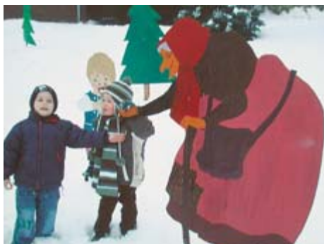
V PRAVLJIČNI DEŽELI – Vzgojiteljice moravskega vrtca park pred vrtcem že vrsto let naseljujejo s pravljimi bitji. Letos je tudi narava poskrbela za pravo zimsko razpoloženje, saj je deželico odela v belo ogrinjalo. Najmlajši obiskovalci so se v njej imenitno počutili.