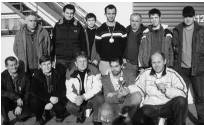
Strelci iz naše občine na tekmovanju v Sebeborcih.

V ekipni konkurenci je prvo mesto pripadlo SD Jože Kerencič, druga je bila ekipa Varstoj Lendava, tretji Sebeborci I in četrta Andrejci.