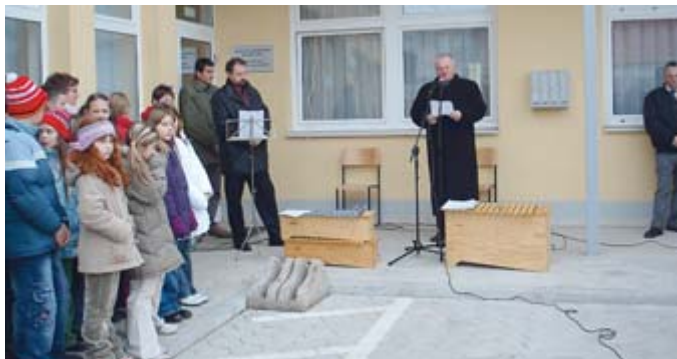
POSLOVNO-STANOVANJSKA STAVBA V PROSENJAKOVCIH – Pred božično-novoletnimi prazniki so slovesno predali v uporabo delovne prostore v novi poslovno-stanovanjski zgradbi v Prosenjakovcih: zdravstveno ambulanto, prostore krajevnega urada in prostore Madžarske narodne samoupravne skupnosti v občini.