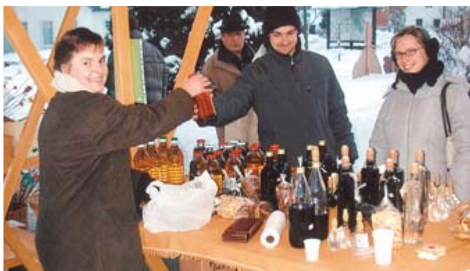
PRAZNIČNI DECEMBER V MORAVSKIH TOPLICAH – Kljub neprijetnemu sneženju in mrazu je led uspešno prebit. TIC je zbral mnogoštevilne ponudnike domačih izdelkov na novoletnem božično-novoletnem sejmu pred evangeličansko cerkvijo; v cerkvi so ves teden potekali nastopi glasbenikov in glasbenih skupin.