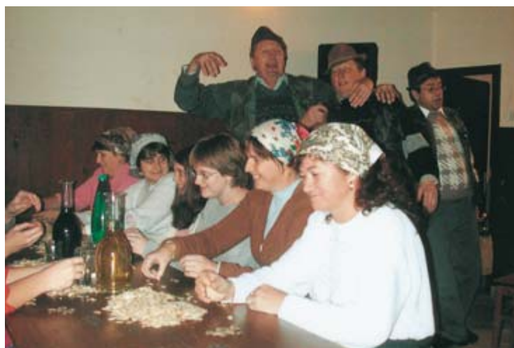
Kako malo je včasih potrebno za prijetno prireditev, so dokazali vrli Goričanci v Vučji Gomili.

Okrog velike mize se je posedlo tudi do deset in več žena, moški tokrat niso bili izjema, čeprav so v resnici marsikdaj raje kartali in srkali kaj močnejšega. Ženske in dekleta so tedaj imele mir pred njimi in so lahko nemoteno opletale z jeziki in obirale številne vaščane. Roke so ob tem seveda nemoteno lupile seme. Tudi zapele so.