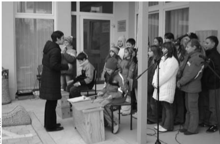
A helybeli iskola tanulóival szavaltakkal és gyermekdalokkal tették színesebbé a székház átadási ünnepélyét

szen sikerült egy központot kialakítani, amely a határ mentén élő emberek központja. Pártosfalva már valamikor is a vidék policentrumának számított, de az elmúlt időszakban ezen szerepét kezdte elveszíteni. Egyre kevesebben keresték fel azokat a hivatalokat, amelyek jelentős szerepet töltenek be egy-egy település életében, legyen az a helyi hivatal, az egészségügyi rendelő vagy a posta. Ezen helyek fontossága túlmutat az ügyeink intézésén, mert az emberek itt találkoznak és beszélgetnek, kapcsolatokat alakítanak ki. Valamennyiünk számára fontos a mai nap, de még fontosabb azoknak, akik holnapra már az új helyiségekben fognak tevékenykedni. Örülök, hogy közös erővel sikerült ezt a beruházást megvalósítani.»