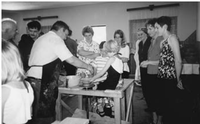
Obujanje lončarske tradicije: starejšim v spomin, mladim za spodbudo ...