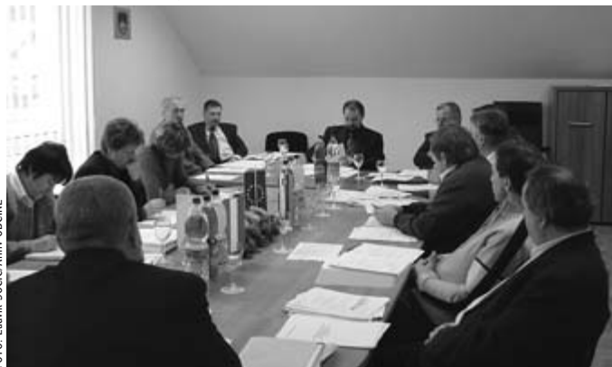
23. redna seja občinskega sveta je potekala v sejni sobi MNSS v Prosenjakovcih.

Bilanca prikazuje prihodke in odhodke proračuna, vključno s prihodki in odhodki krajevnih skupnosti. Spomnimo: prihodki proračuna obsegajo: davčne, nedavčne in kapitalske prihodke, prejete donacije ter transferne prihodke, odhodki pa: tekoče odhodke, tekoče transfere, investicijske odhodke in investicijske transfere.