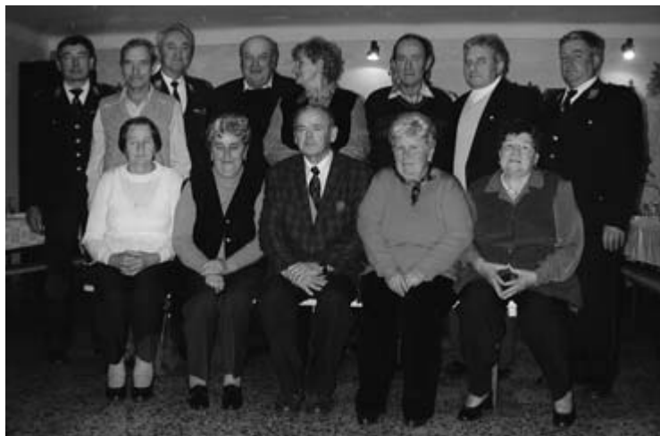
Gasilskim veteranom – v vseh 27 PGD jih je več kot 200 – se je letos pridružilo 14 novih članov, med njimi kar šest gasilk.

Program srečanja so s številnimi kulturnimi točkami popestrili učenci OŠ Fokovci.