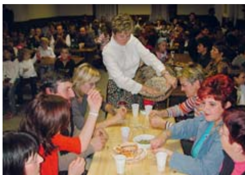
PRIREDITVE Z ETNOGRAFSKIM OZADJEM – V Vučji Gomili so to jesen znova lujpali tikvino semen, v Selu pa kukorco. Prireditve se naslanjajo na skupinska kmečka opravila, največkrat jih je spremljala tudi bogato obložena miza.