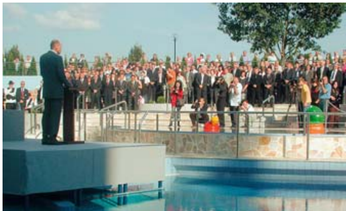
HOTEL LIVADA PRESTIGE**** V MORAVSKIH TOPLICAH – Zbrane je nagovoril predsednik Vlade RS Janez Janša in odprte hotela najvišje kategorije označil kot vrhunec turističnega razvoja v Moravskih Toplicah.