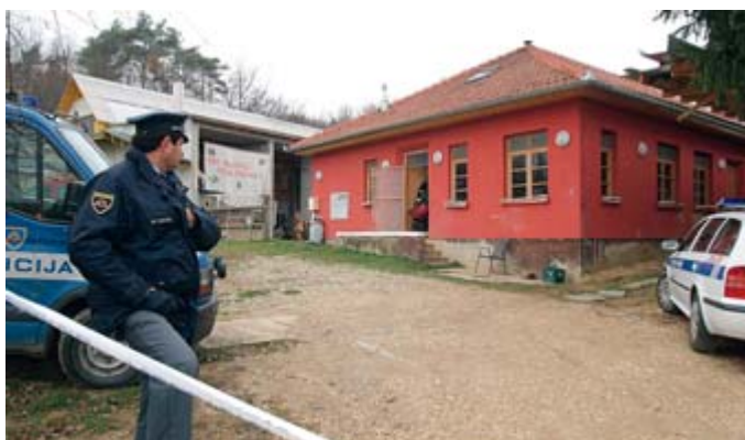
DELOŽACIJA V SREDIŠKEM ART CENTRU – Konec novembra so iz Art centra izselili štiri stanovalce. Objekt nima uporabnega dovoljenja in bivanje v njem zato ni mogoče. Mar je to konec zapletov v Središču ali le začetek novih peripetij?