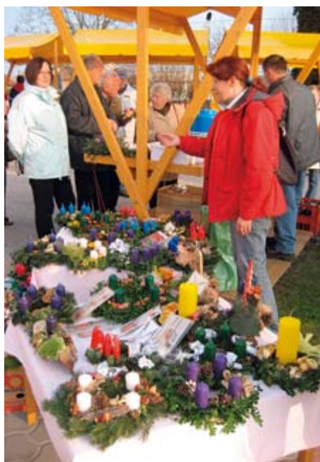
Na adventnem sejmu v Moravskih Toplicah so venčke in druge izdelke ponudili tudi člani TD Martin iz Martjanec.

Adventni sejem je v parku pred vrtcem tudi tokrat odlično dopolnila pravljicna dežela, za najmlajše je bila v hotelu Vivat na sporedu igrica za otroke, v cerkvi pa adventni koncert moškega vokalnega kvinteta. (G. G.)