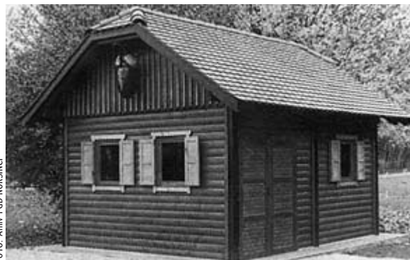
Gasilski muzej je lahko zanimiva turistična točka.